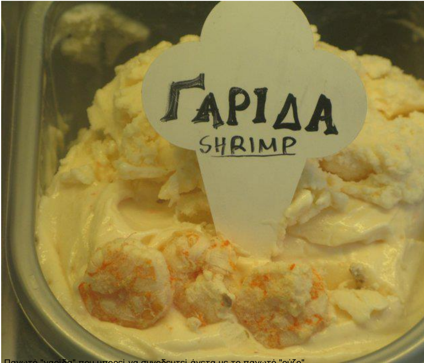
Παγωτό "γαρίδα" που μπορεί να συνοδευτεί άνετα με το παγωτό "ούζο"