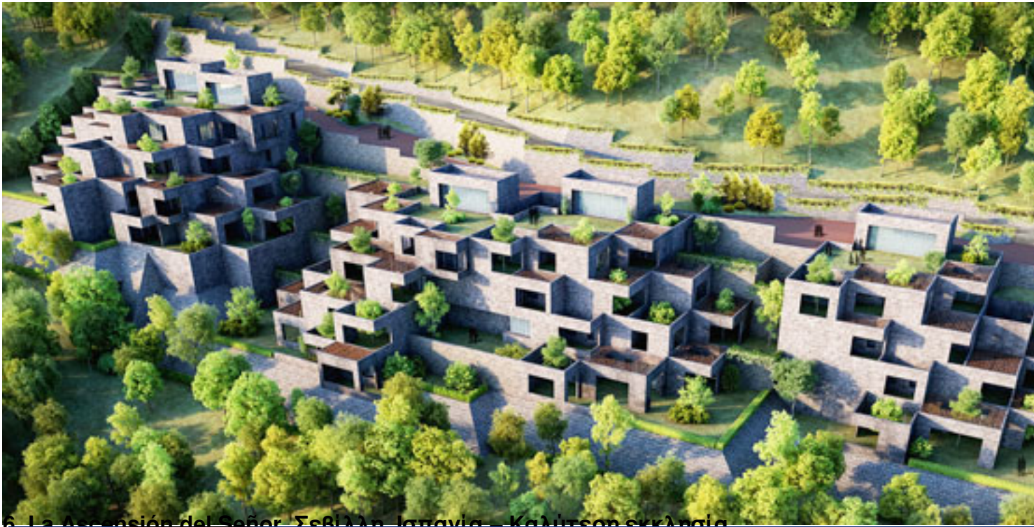
6. La Ascensión del Señor, Σεβίλλη, Ισπανία – Καλύτερη εκκλιση