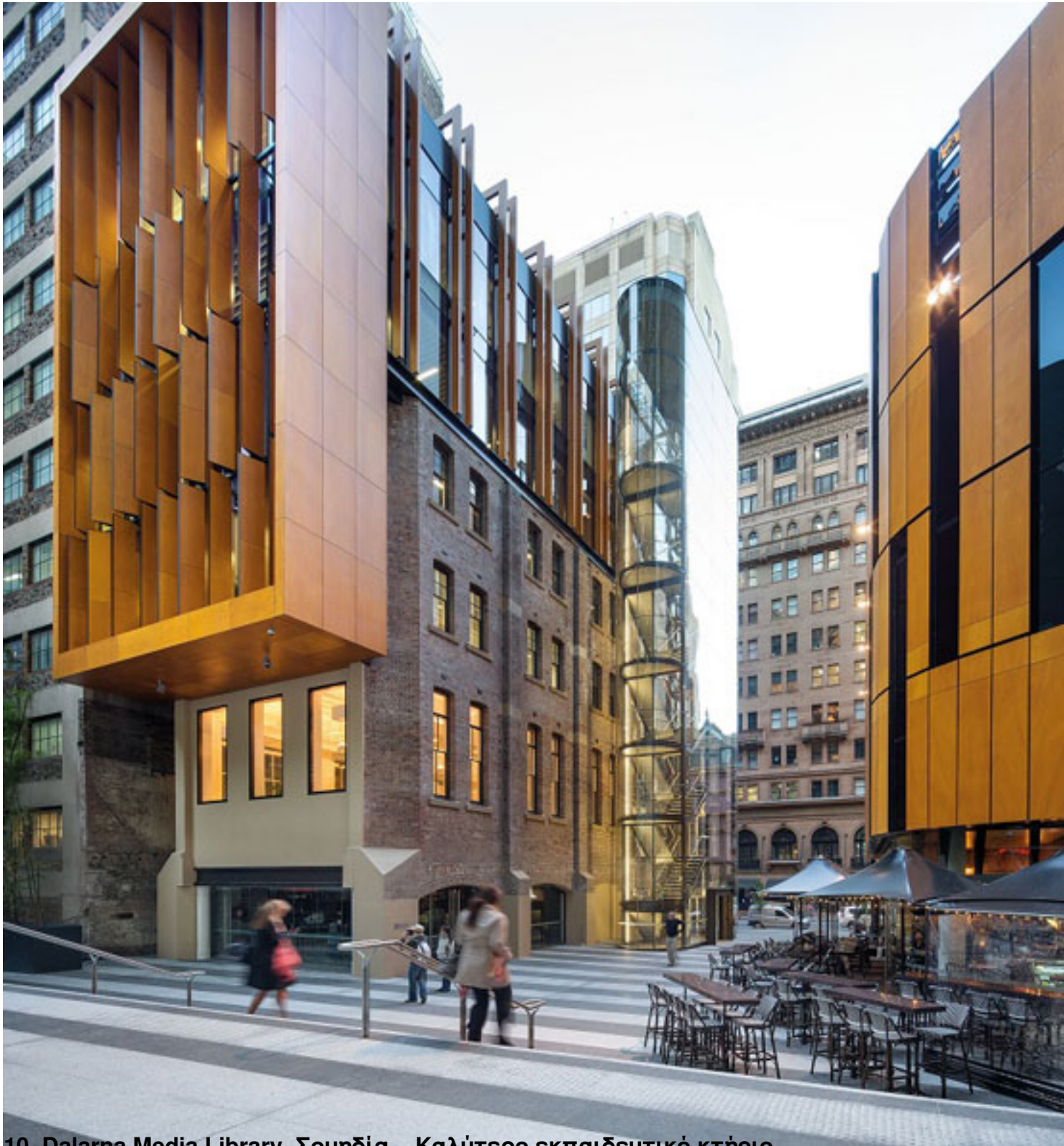
10. Dalarna Media Library, Σουηδία – Καλύτερο εκπαιδευτικό κτήριο