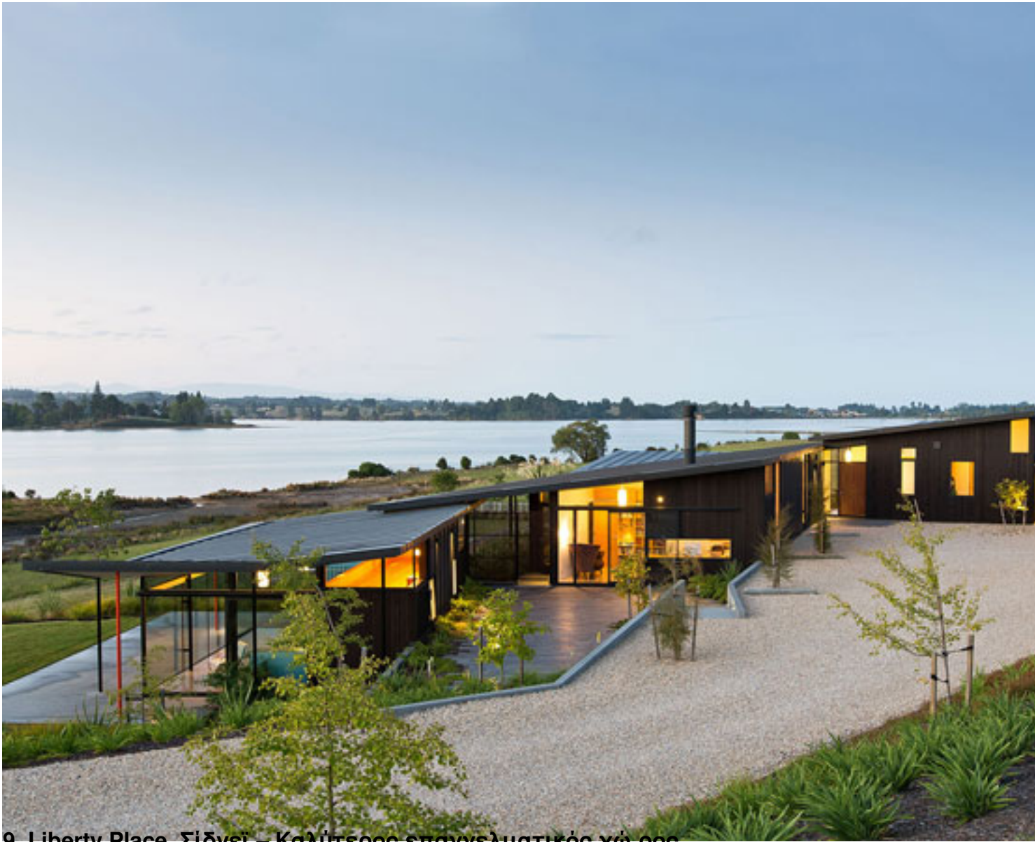
9. Liberty Place, Σίδνεϊ – Καλύτερος επαγγελματικός χώρος