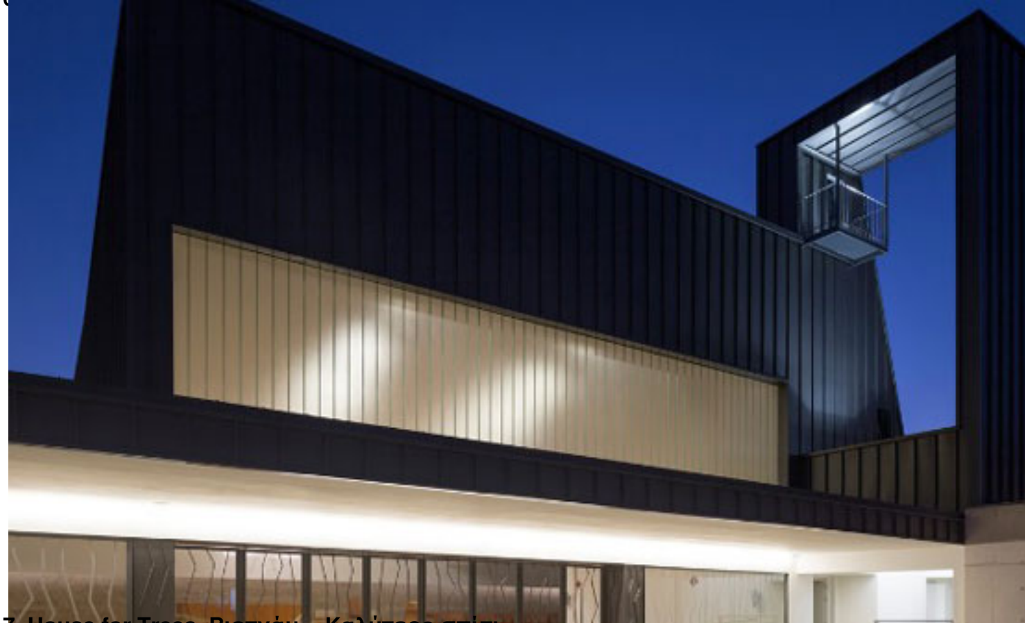
7. House for Trees, Βιετνάμ – Καλύτερο σπίτι