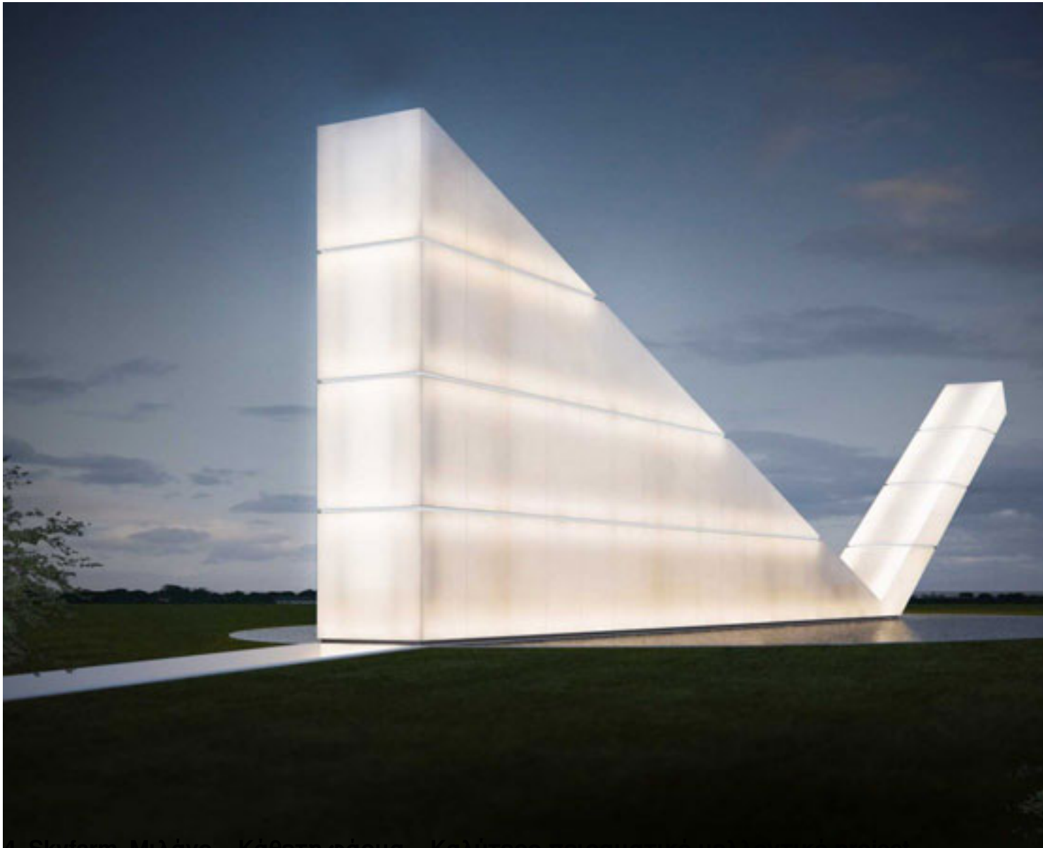
4. Skygarden, Μιλάνο – κάθετη φάρμα – καλύτερο πετρωματικό μελλοντικό project