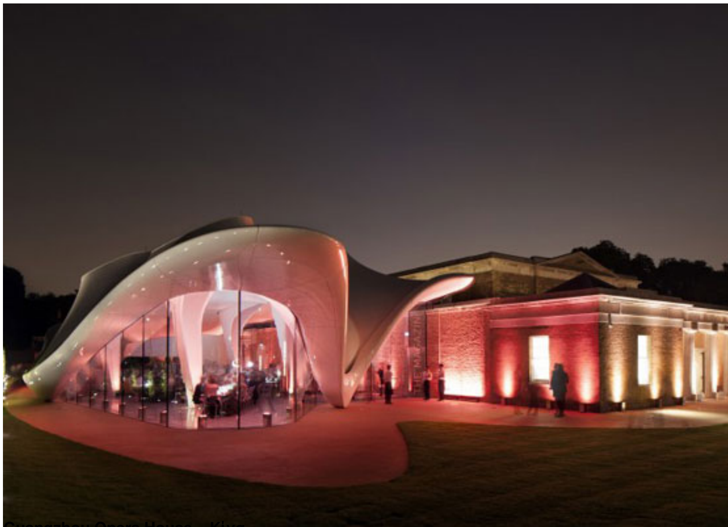
Guangzhou Opera House – Ktva