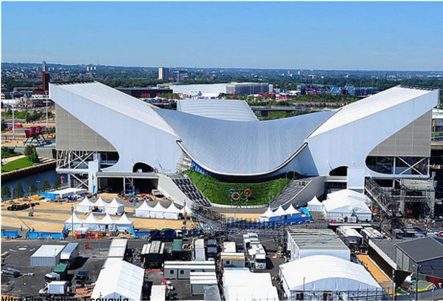
Vitra Fire Station- Γερμανία