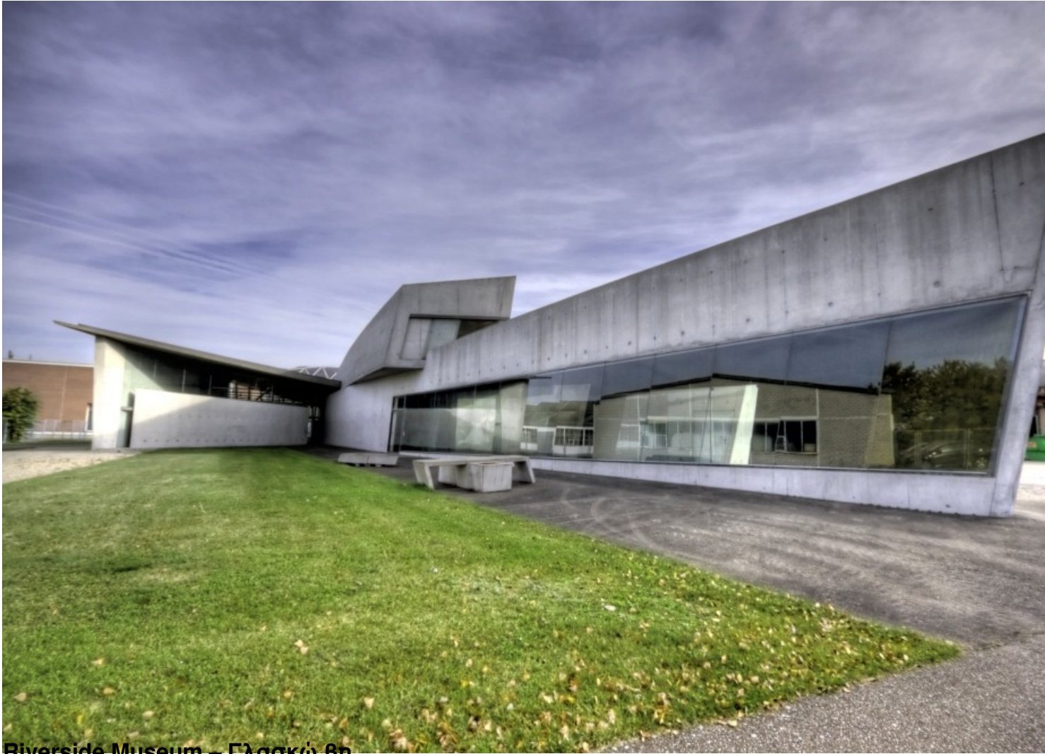
Riverside Museum – Γλασκώ βη