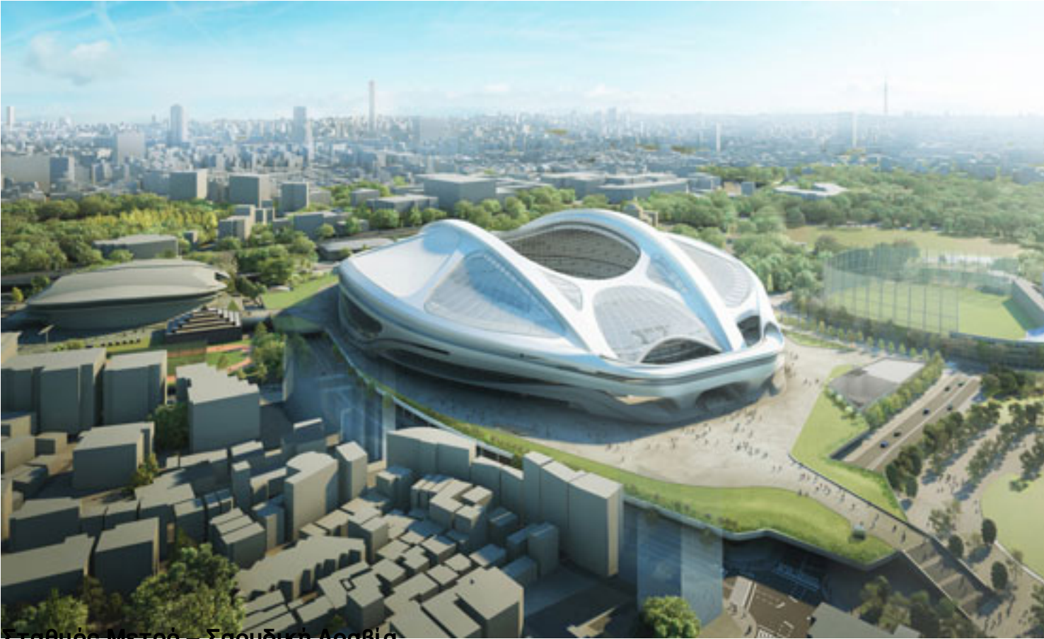
Σταθμός Μετρό – Σαουδική Αραβία