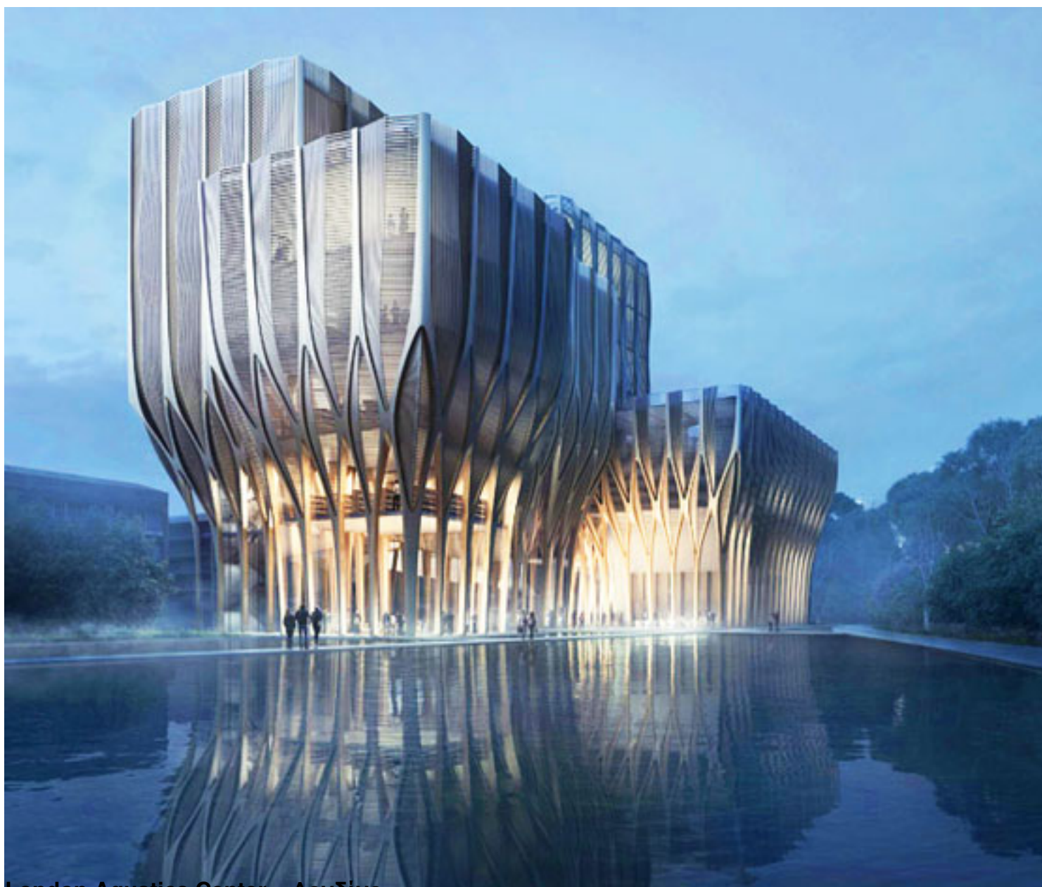
London Aquatics Center – Λονδίνο