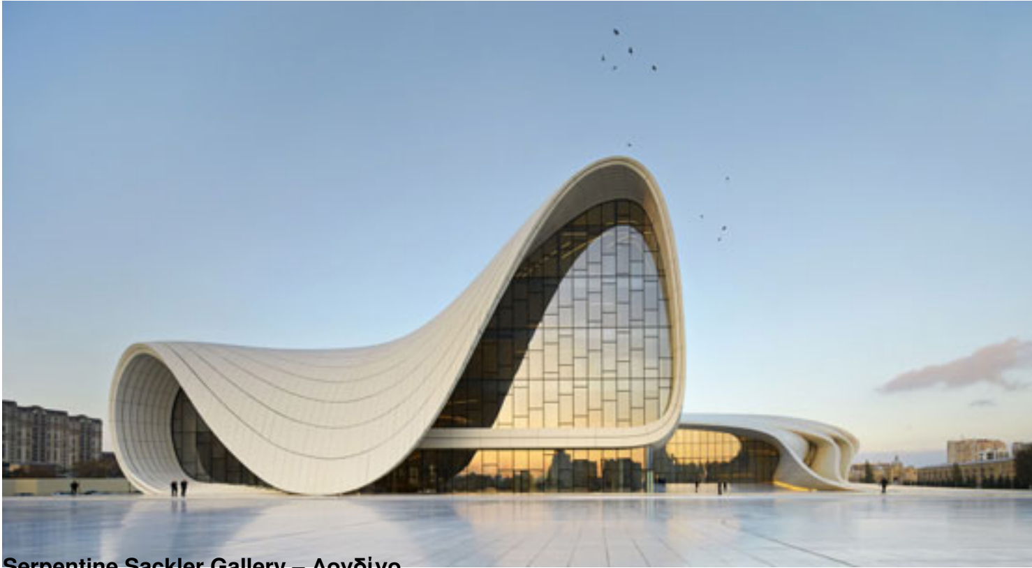
Serpentine Sackler Gallery – Λονδίνο