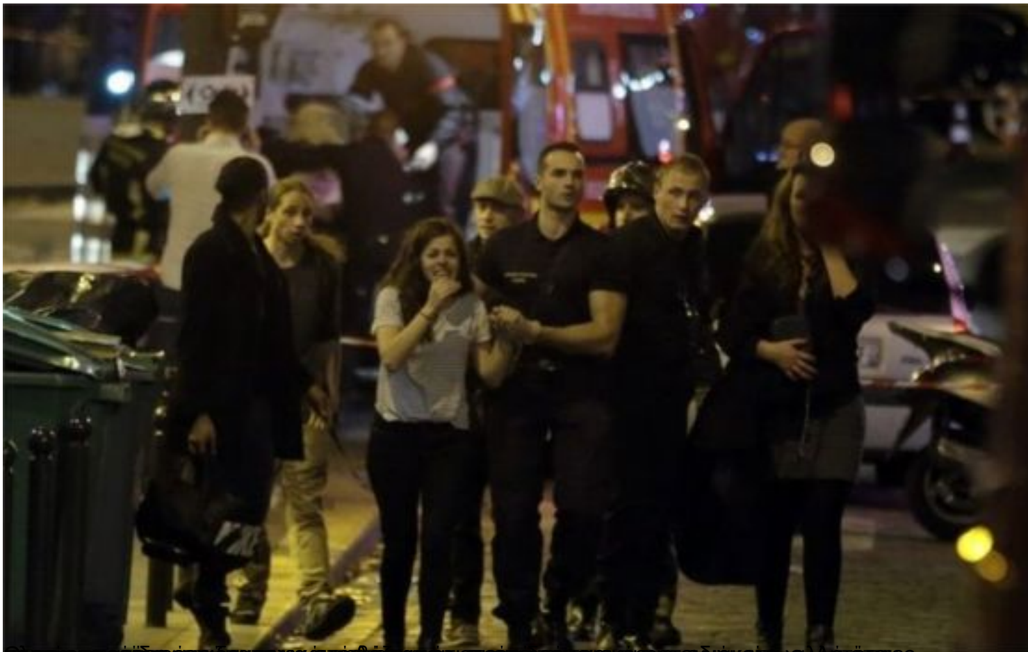
Πολιτοφυλάκιες και αστυνομικοί ασφαλισμένοι από μπαράζ επιθέσεων, 13 Οκτωβρίου 2015. Απόψεις