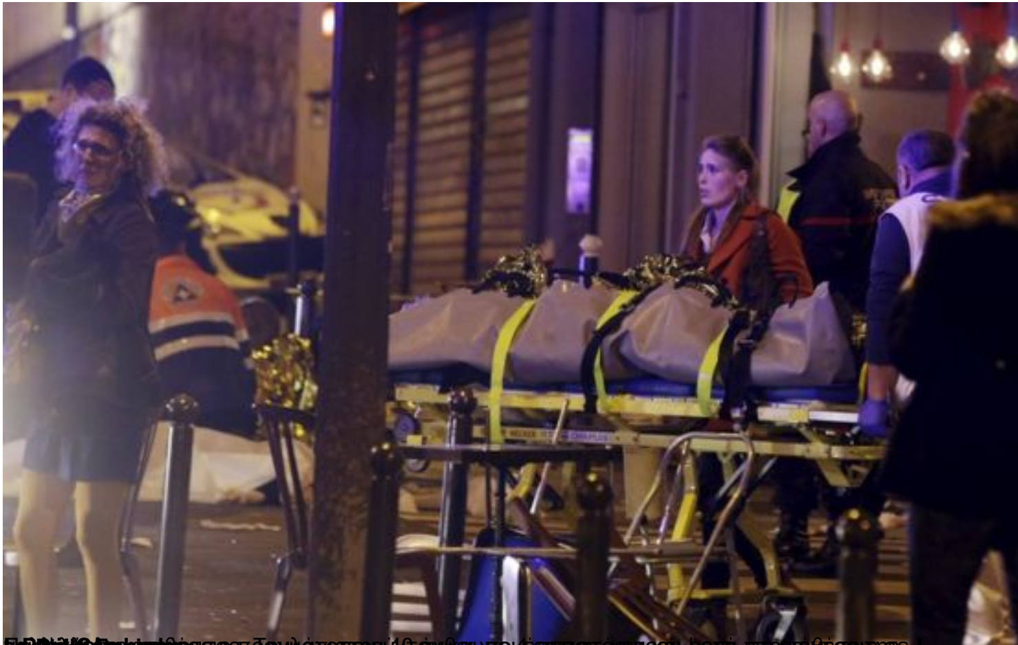
Εκτακτο περιστατικό στο Παρίσι: ένας νεκρός μεταφέρεται σε ασθενοφόρο. Ο αριθμός των νεκρών από τις επιθέσεις φέρνει το σύνολο των θανάτων σε 49 άτομα και 450 τραυματίες.