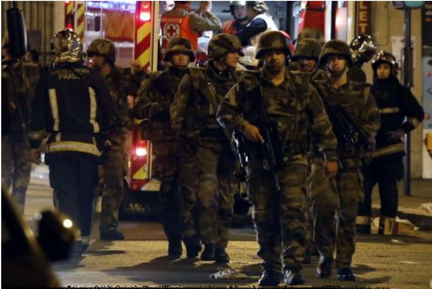
Στρατιώτες σε οπλοεξοπλισμό μάχης, στο Παρίσι, μετά από τις επιθέσεις τρομοκρατών που οδήγησαν στο θάνατο εκατόν πενήντα ανθρώπων, κατά το