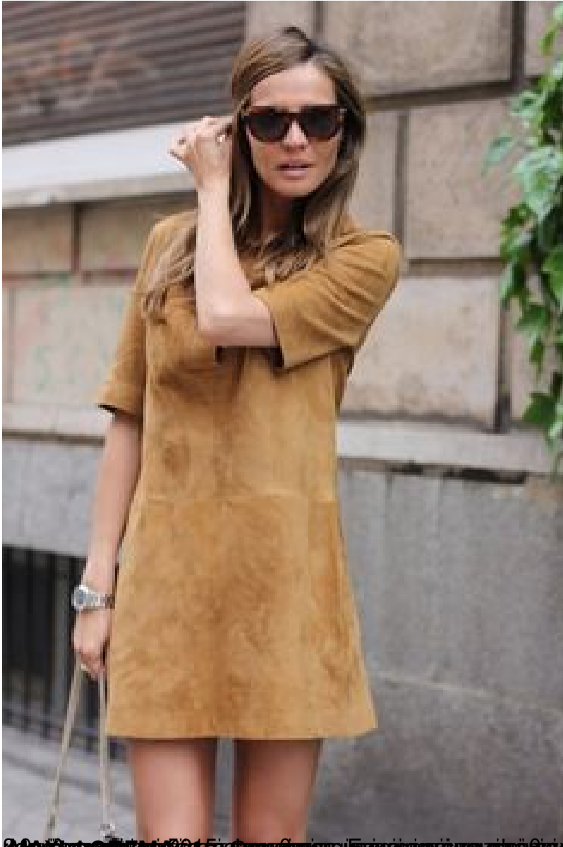
30 Αύγουστο 2024, 5:58 πμ - Γενικά, η μόδα είναι πάντα ένα παιχνίδι με τα χρόνια. Τα 70's είναι η μεγαλύτερη τάση τώρα. Έλα floppy